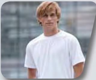
Sublimation-T = JN350