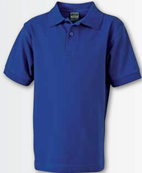
JN070k royal oscuro