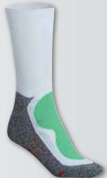
JN211 blanco/ verde