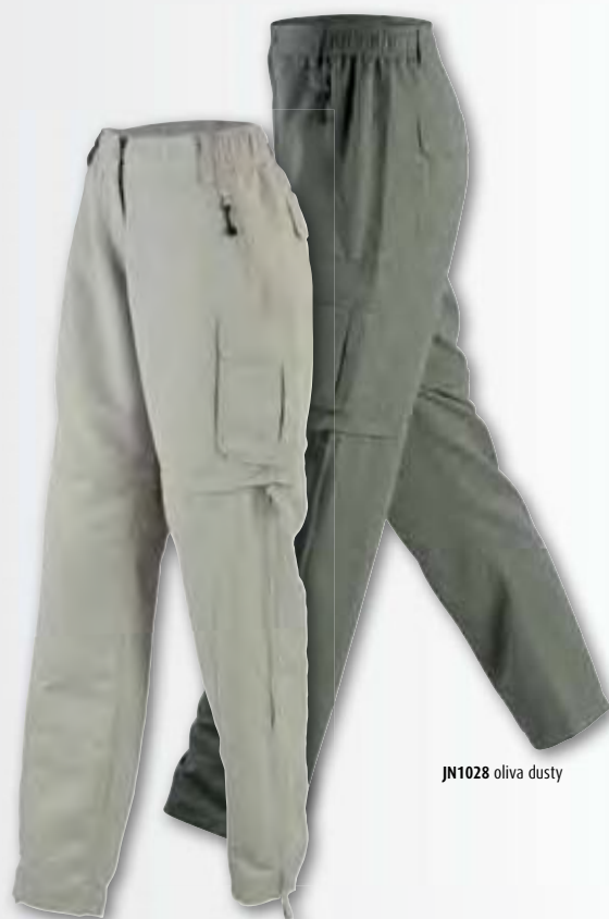
JN1028 oliva dusty